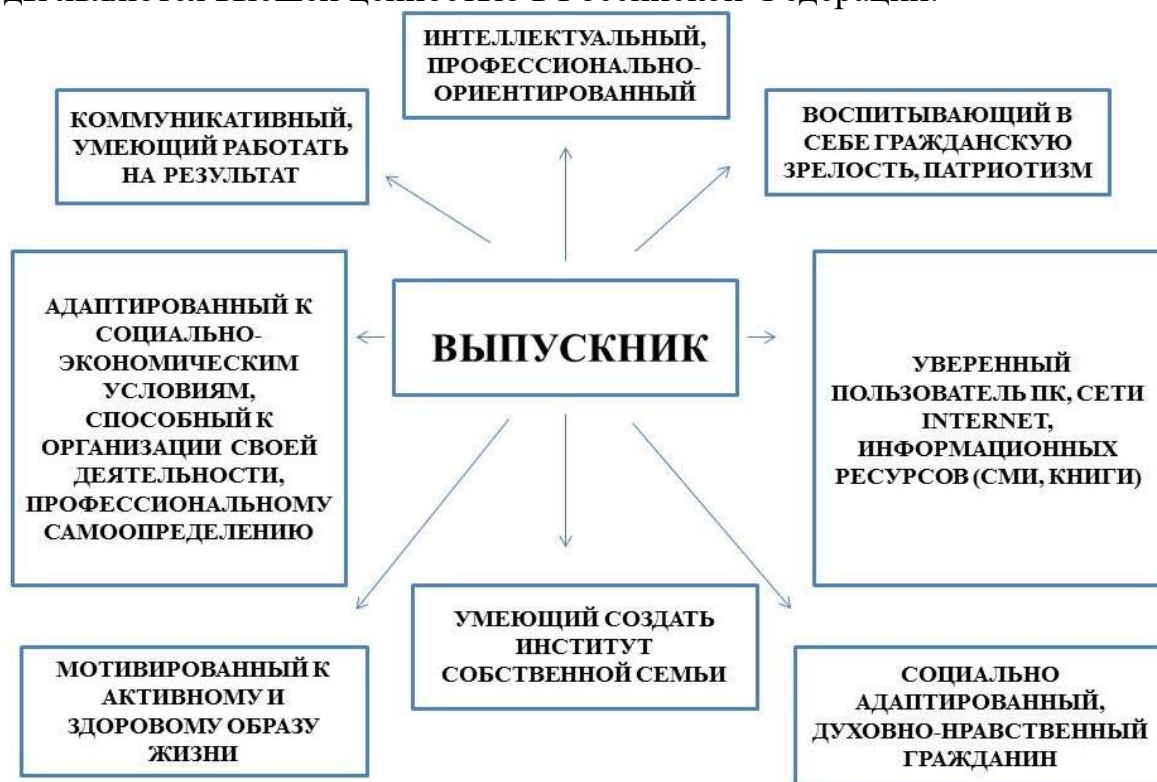
Рис. 1 – Вариативная модель целеполагания воспитательной работы в Институте, ориентированная на выпускника

Использование в воспитательном процессе идеи того, что человек его права и свободы являются высшей ценностью в Российской Федерации.